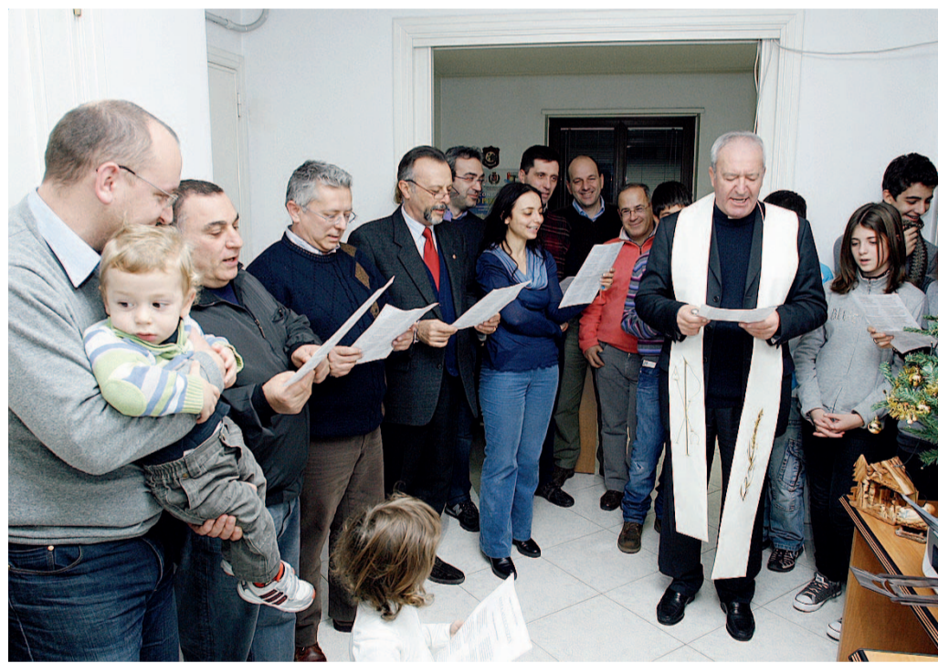
FESTA DI NATALE Un momento della cerimonia ieri sera nella nostra redazione

La Fondazione Vincenzo Casillo e la Molino Casillo spa in collaborazione con Teatro dei Borgia e Teatro Pubblico Pugliese presentano