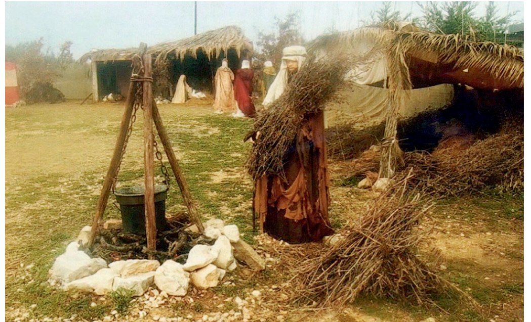
Una scena del presepe ambientato in contrada Cocuzzo, ad Andria

Questa sera, alle 22.30, apre il grande allestimento in aperta campagna